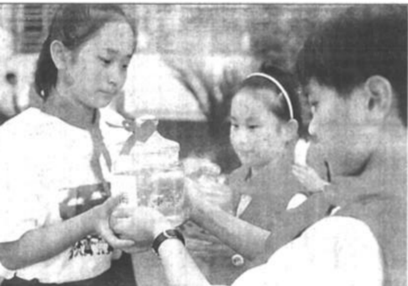
7月14日,来自上海市的55名少年儿童与青海省的少年儿童相聚在古城西宁,开展“共饮长江水 我爱母亲河”沪、青两地少儿手拉手活动。他们通过各种交流互动加深了解,结下深厚的“一江水”情缘,并宣誓共同保护母亲河。图为上海、青海两地少儿代表互换各自带来的“家乡水”。一份来自长江之尾黄浦江,一份来自长江源头通天河。

华民族在世界上有了越来越高的威望,奥运会成功申办证明了我们的国力。在悉尼奥运会上夺得女子柔道冠军的唐琳感慨地说,我为中国成功申办奥运会感到自豪,我会用勇夺金牌的精神,用我的全部心血,去培养众多的小唐琳,为我们祖国争光。 作为2005年第十届全国运动会的东道主,江苏决心全力以赴,办好十运会,为中国运动健儿在2008年奥运会上夺得好成绩做出贡献。南京体育学院院长华洪洪说:“承办奥运会给中国体育界搭了一个大舞台,而第十届全国运动会则赋予江苏一个难得的历史机遇。我们一定要迎难而上,抓住机遇,推动江苏体育实现历史性的大跨越!”