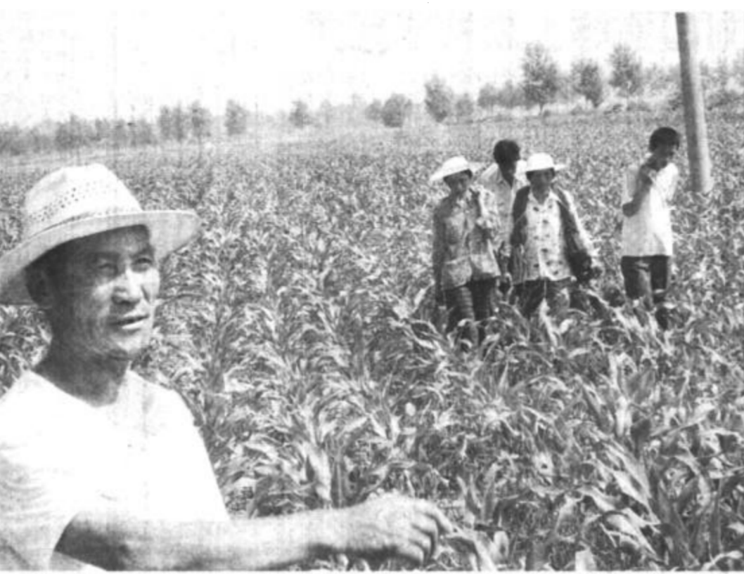
广饶县石村4.2万亩夏季作物长势良好，该镇党委、政府抓住当前墒情良好的有利时机，组织农民全力以赴投入夏管工作，确保丰收。

收听收看后，副市长陈胜就狠抓考风考纪和保证学生安全工作提出要求。他说，建市18年来，我市高考工作总的情况是好的，没有出现任何违纪问题，受到上级肯定和人民群众的高度赞扬。他指出，高考工作关系到学生的前途，关系到我们事业的发展，各级教育主管部门肩负光荣而重大的使命，要认真贯彻落实江泽民总书记“七一”重要讲话精神，切实做到以“三个代表”的重要思想指导实际工作。对于今年高考过程中出现的梁山、曹县考生舞弊情况和学校安全工作存在的问题，全市各级各有关部门要以对党和人民高度负责的精神，本着“举一反三、预防为主、堵疏结合、依法管理、落实责任”的原则，切实抓好。同时，做好学校各项安全工作，保证学生人身安全，不辜负党和人民的重托。(记者 彭华)